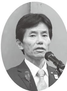
山形県庄内総合支庁