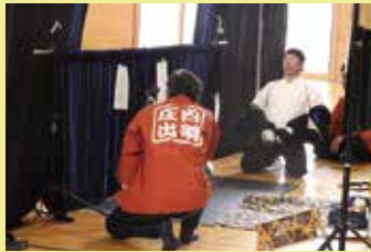
全集中「いざっ!本番!」