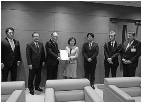
矢口・酒田市長に提言書提出