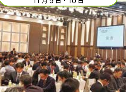
大川部会長が「部会長サミット」で発表!