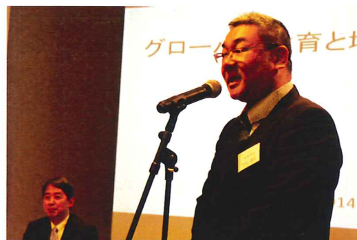
杉山部会長 新年のごあいさつ