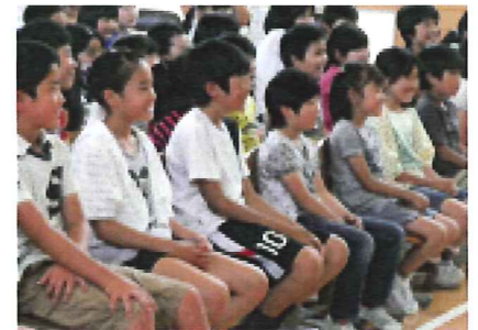
真剣に見入る子供たち