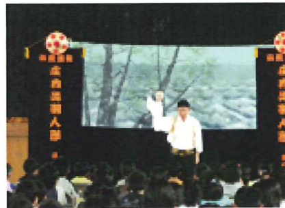
酒田市立内郷小学校にて