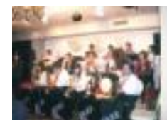
キーブスイングビッグバンド