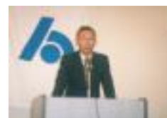
来賓挨拶 南税務署長