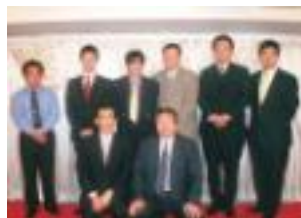
新旧部会長と新入会員