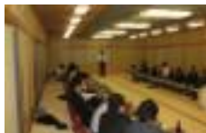
協議会 風景(今だけ整然)