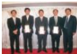
新旧部会長と卒業生