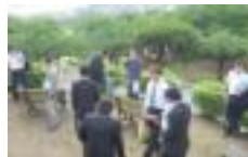
どこかと思ったら「日和山」