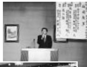
講演をする担当官