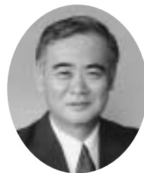
社団法人酒田法人会