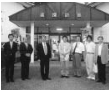
東北銘醸㈱ 蔵探訪館にて