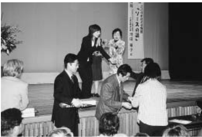
ギフトセット抽選会