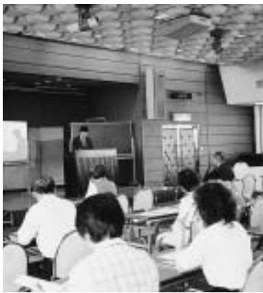
解りやすく説明する講師