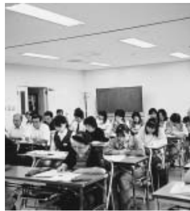
熱心に聴講する受講者