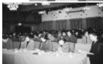
メモを取る女性部会会員